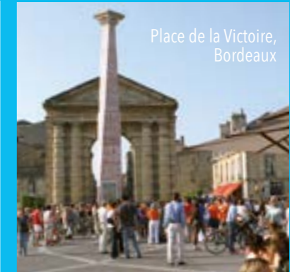
Place de la Victoire, Bordeaux