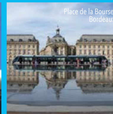
Place de la Bourse, Bordeaux