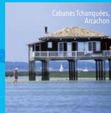
Cabanes Tchanquées, Arcachon