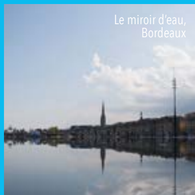
Le miroir d'eau, Bordeaux