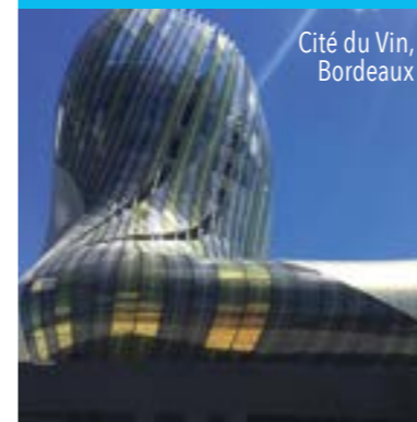
Cité du Vin, Bordeaux