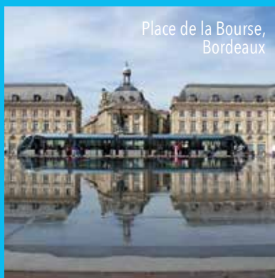
Place de la Bourse, Bordeaux