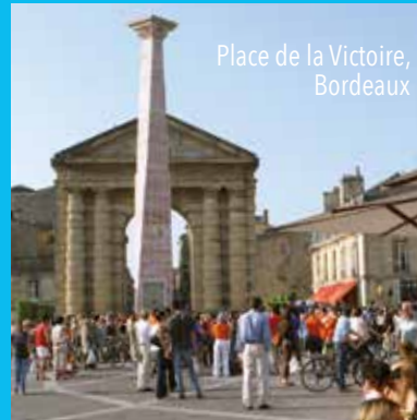
Place de la Victoire, Bordeaux