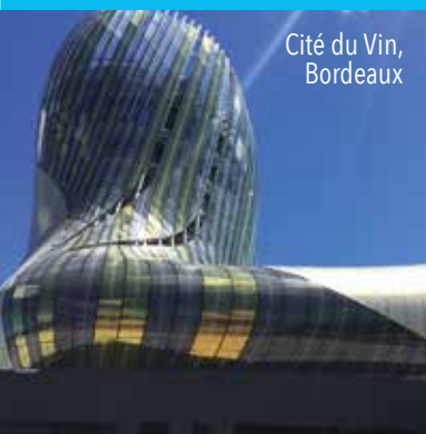
Cité du Vin, Bordeaux