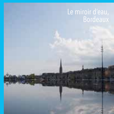
Le miroir d'eau, Bordeaux